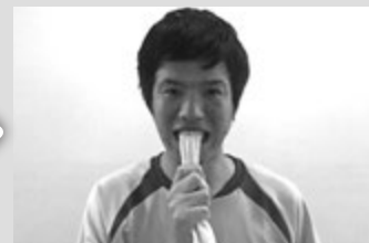
3)前歯でタオルを軽く噛み、3 秒タオルを引っ張る