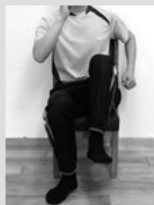
2)左足を上げ、 ゆっくり下ろし ます