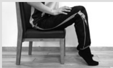
2)つま先を軸に、かかとを上げ、下ろします。