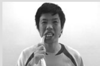
1)右奥歯でタオルを軽く噛み、3秒 タオルを引っ張る