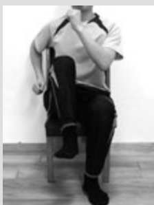
1)右足を上げ、 ゆっくり下ろし ます