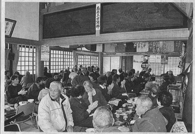
テナーサックスの演奏を楽しむ参拝者